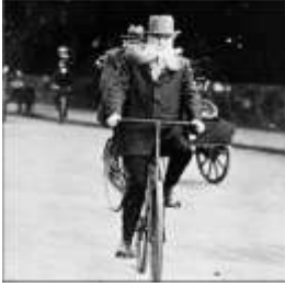
John Boyd Dunlop

Bisiklet tekerleği bir veteriner tarafından icat edildi.